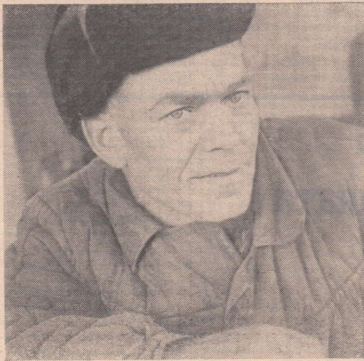
Фото В. СТРЕПЕТКОВА.